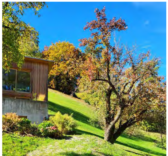
Hochstämme, wie dieser über 200 Jahre alte Baum der Kügilibirne, werden immer seltener