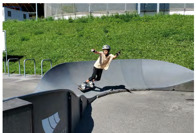
Vorbereitendes Sommertraining auf dem Skateboard