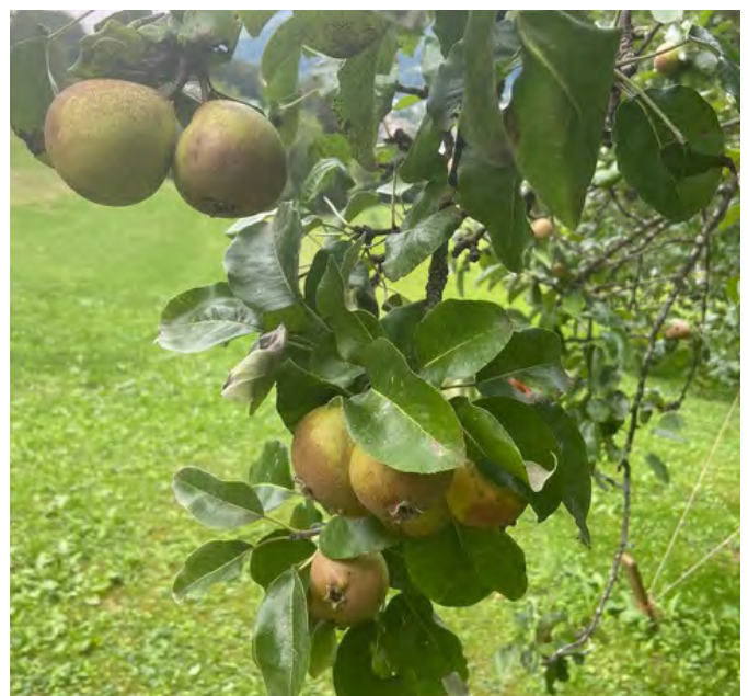
So schaut die Frucht der Kügilibirne aus