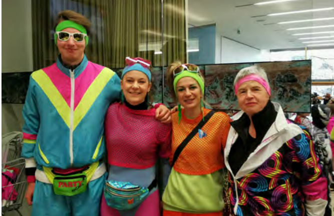
Die Golnis sorgten für das leibliche Wohl.

vorbeischaute und mit uns zusammen auf den Faschingsausklang angestoßen haben! Schön, dass auch ein „lustiger Trupp“ vom Seniorenturnen es sich nicht nehmen ließ vorbeizuschauen! Als kleines Dankeschön der Gemeinde erhielt jedes Kind einen Krapfen und ein Getränk! Vielen Dank an die „Golnis“ für die gewohnt perfekte Bewirtung am Faschingsdienstag!