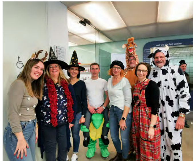
Die Gemeindeverwaltung hatte auch Grund zum Lachen.