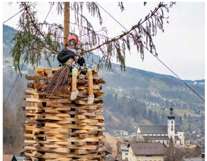
Die traditionelle Hexe durfte beim Funken nicht fehlen.