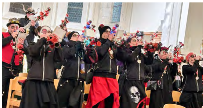
Die Kehlegger Schalmeien bei ihrer musikalischen Darbietung in der Kirche