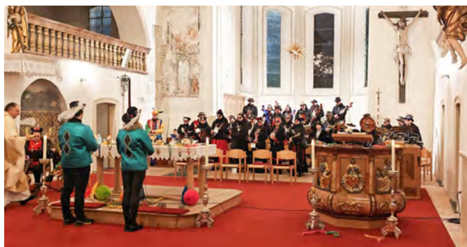
Zum ersten Mal überhaupt gab es in Tschagguns eine Fasnatsontigs-Mess.

Und für alle, die leider nichts von der Messe wussten – nächstes Jahr: Faschingssonntag um 18:30 Uhr findet die nächste Fasnatsontigs-Mess statt.