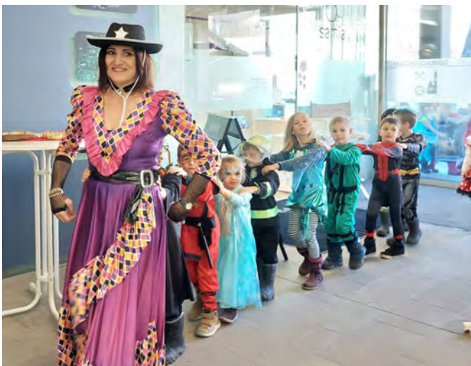
Auch der Kindi stattete einen Besuch beim Gemeindeamt ab.