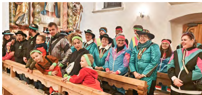
Die Golnis organisierten das tolle Rahmenprogramm.