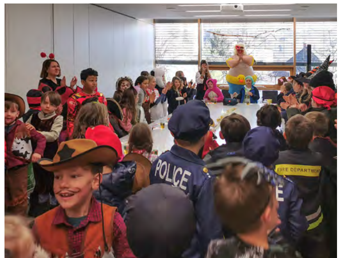
Die Schüler der Volksschule