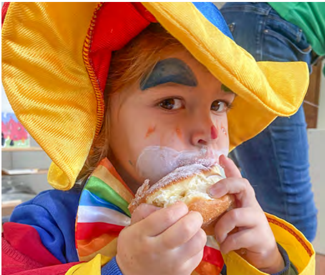
Der Faschingskrapfen schmeckte dem Mäscherle offensichtlich.