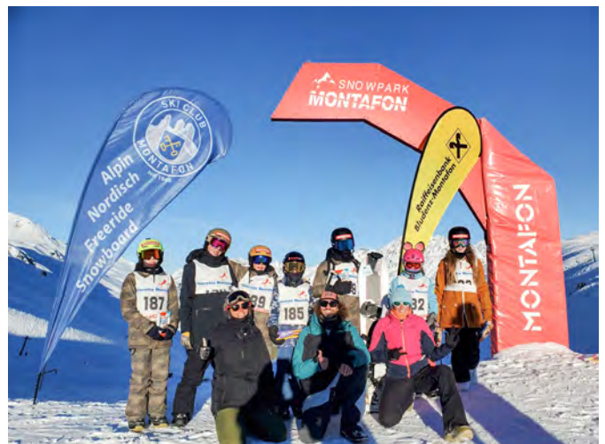
Der Skiclub Montafon Snowboard-Kader beim SCM-Cup am Fredakopf

Das spezielle Programm „Let’s go Snowboarding“ ist für interessierte Kids im Alter von 8 bis 12 Jahren, die ihr Eigenkönnen verbessern möchten. Anmeldungen zum Schnuppern sowie Fragen zur Snowboard-Gruppe beim Skiclub Montafon können direkt an Babsi Hoffmann (babsihoffmann@gmx.at) gerichtet werden.