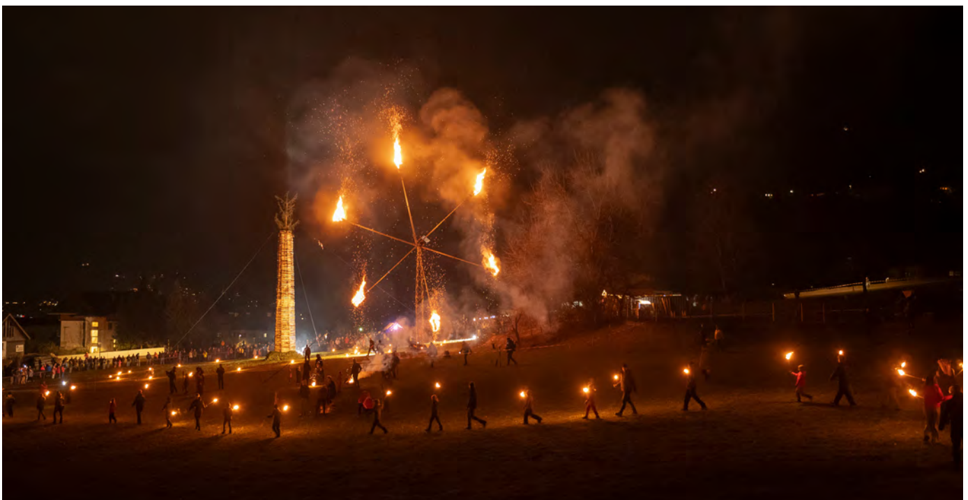
Unmittelbar vor dem Anzünden des Funkens sind die Kinder des Schülerkaders des Wintersportvereines mit brennenden Fackeln eingelaufen.