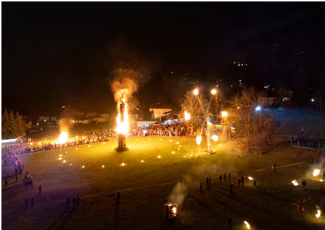
Tolle Kulisse beim diesjährigen Funken