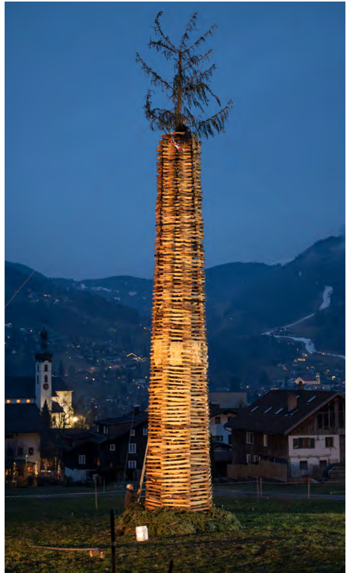
Der Tschaggunser Funken bei Dämmerung, kurz vor dem Anzünden.

Vielen Dank an die Feuerwehren, die unsere Funken überwachen, der Harmoniemusik Tschagguns für die musikalische Begleitung bei einigen Funken und an alle ehrenamtlichen, freiwilligen Helferinnen und Helfer, die unser Brauchtum des Funkenabbrennens „hoch halten“!