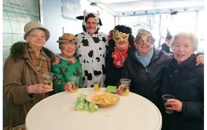
Die Seniorinnen hatten mit Bürgermeister Bitschnau sichtlich Spaß.