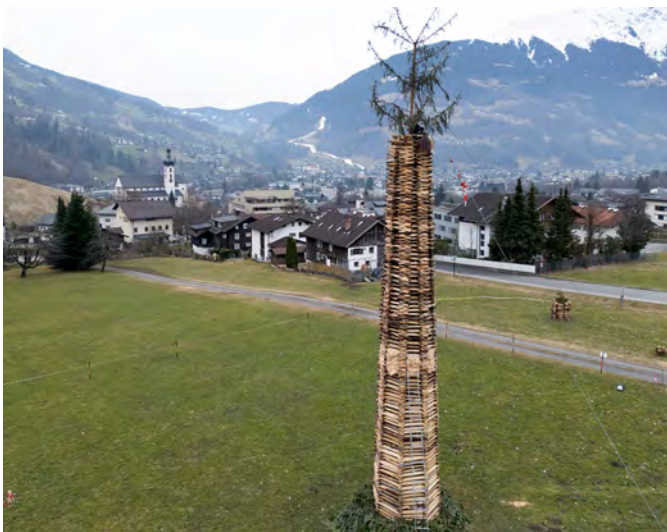
Der diesjährige Funken hatte eine Gesamthöhe von 14 Metern.